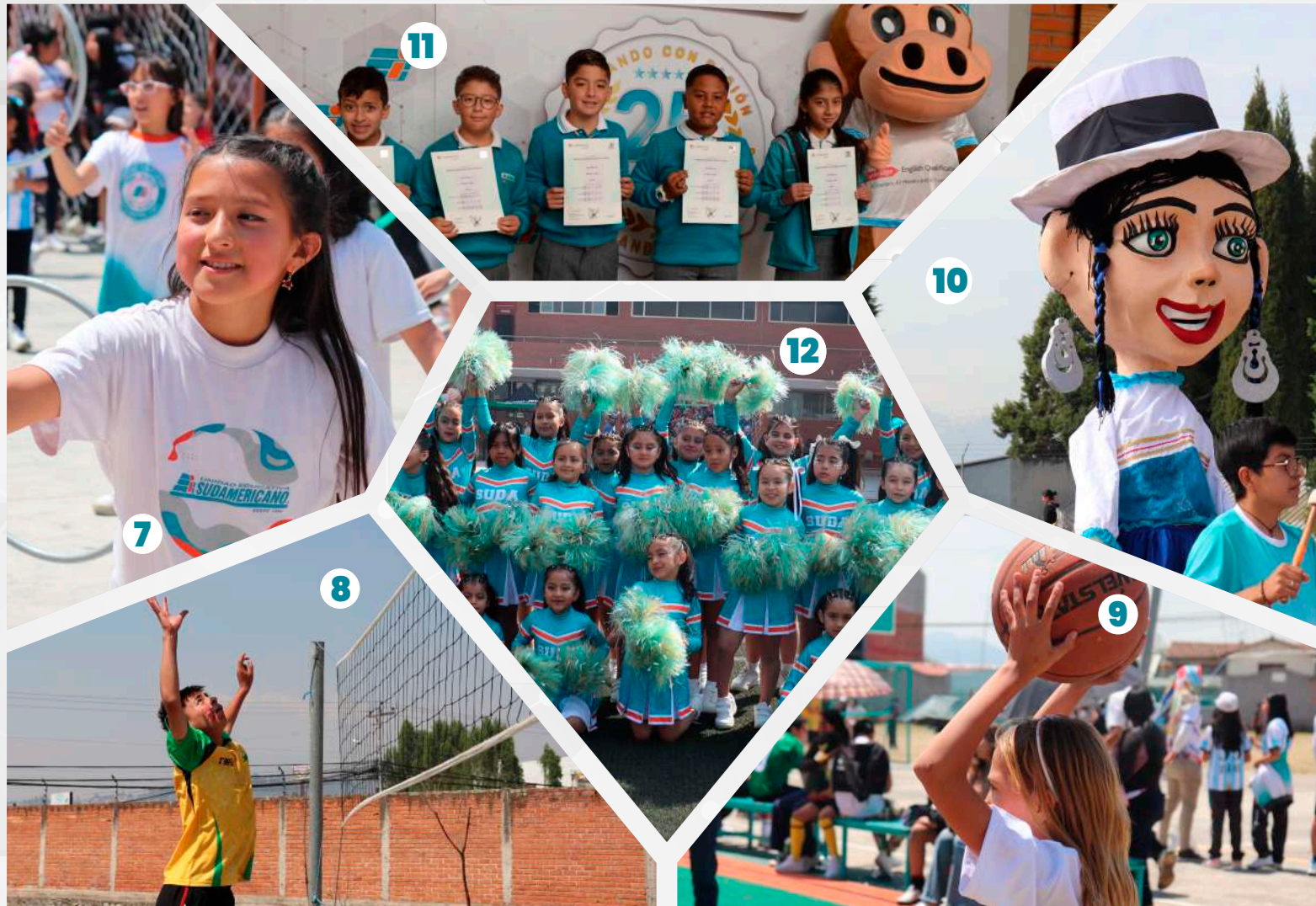
7. Danza Contemporánea – 8. Volleyball – 9. Basket – 10. Cholas Mecánicas – 11. Inglés – 12. Cheerleaders