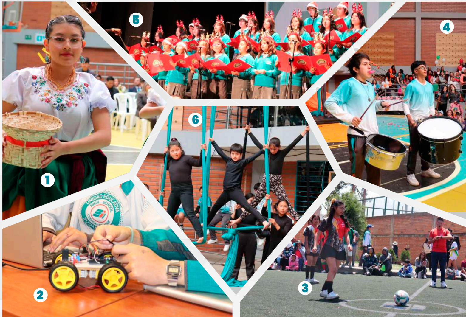
1. Danza Folklórica – 2. Robótica – 3. Fútbol – 4. Batucada – 5. Música – 6. Danza Aérea